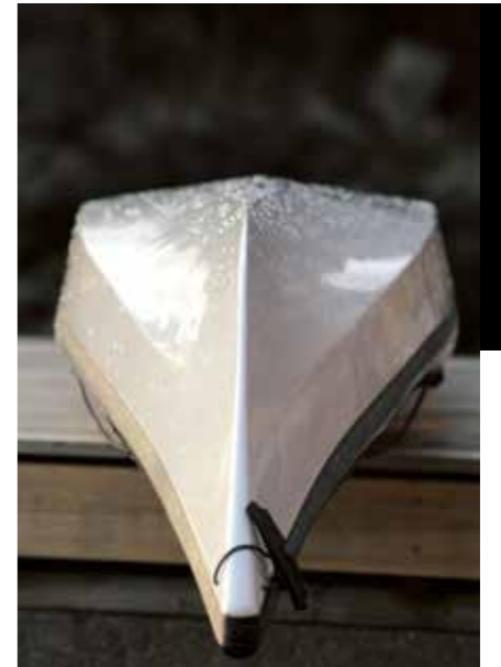
▲ Klassisk grøndlandskajak i bunnprofilen.