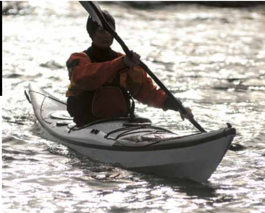
▲ Framdekket er litt tykt, så det er lett å slå borti med årebladet.