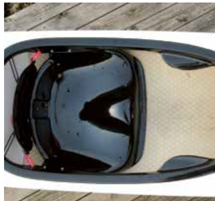
▲ Veldig stor sittebrønn og godt sete med dreneringshull.