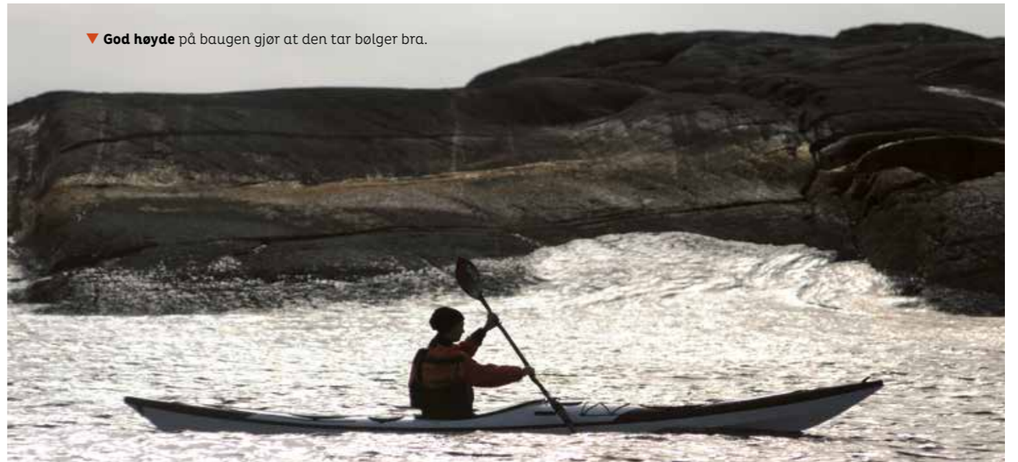
▼ God høyde på baugen gjør at den tar bølger bra.

Selvfølgelig måtte Bylgja testes i bølger. Det var ikke det helt store i testperioden, men litt klarte nå Vestlandet å oppdrive i mai. Den oppførte seg fint i bølger og kaster vannet ut til siden ved motsjø. I medsjø surfer den helt gjennomsnittlig.