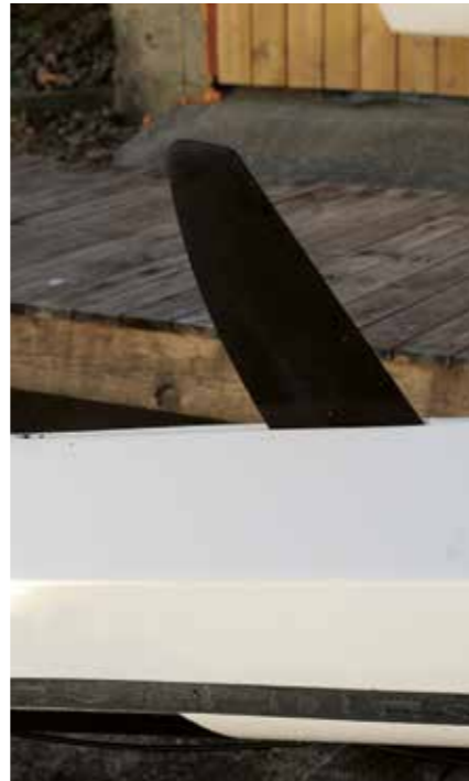
▲ Effektiv senkekjøl.