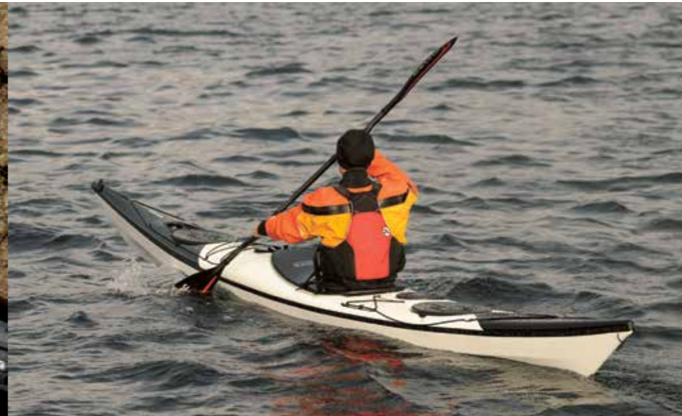
▲ En detalj jeg likte var at redningslinen var akkurat passe slakk så den var lett å gripe.