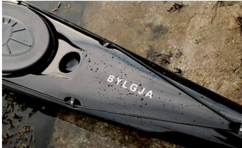
▲ Kompassgrop finnes , men kajakken mangler strikk framme til reserveåren.