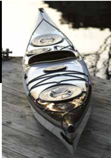
▲ To store , ovale luker og to mindre dagsluker.